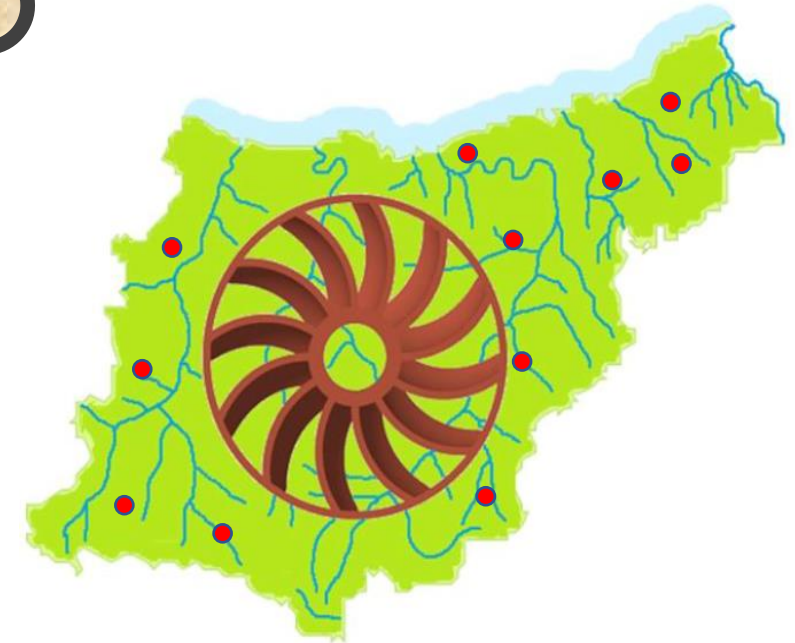
Gipuzkoako Erroten Eguna Ekitaldiak: maiatzak 8 Tokian tokikoa