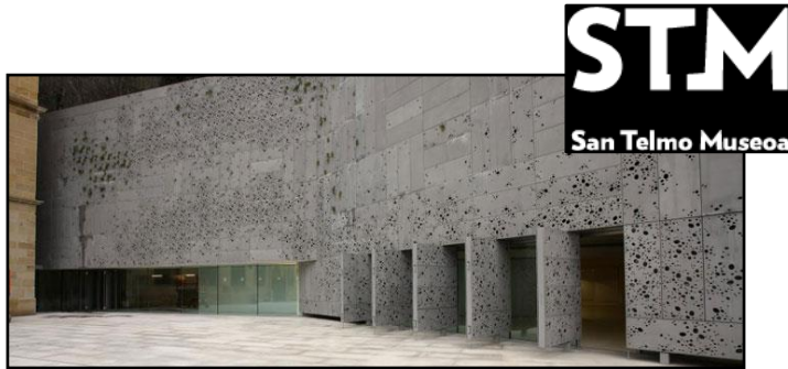
Gipuzkoako Erroten Eguna Aurkezpena: apirilak 27 Hitzaldia: maiatzak 3 ST Museoa